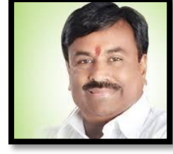
सुधीर मुनगंटीवार मंत्री (वित्त, नियोजन व वने)